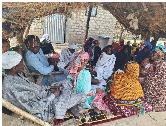
Séances d'échanges sur l'utilisation des connaissances et savoirs traditionnels pour l'adaptation aux changements climatiques

Les impacts des changements climatiques s'observent à travers les intempéries (forte