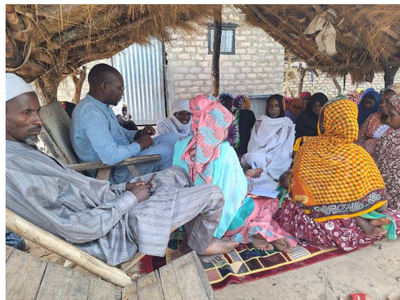
Les femmes autochtones en pleine séance de communication sur les changements climatiques

Dans le cadre de la mise en œuvre des activités du projet « Renforcement de la Résilience des Communautés Locales face aux impacts des changements climatiques (PRRCL) » financé par le Fonds Vert pour le Climat, une équipe d'Experts formateurs a effectué une mission de formation sur « les systèmes de savoirs traditionnels en matière d'adaptation aux changements climatiques », du 02 au 09 août 2023 à RENI, dans la Province du Moyen chari.